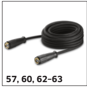
57, 60, 62-63