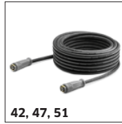
42, 47, 51