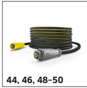
44, 46, 48-50