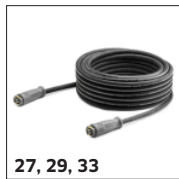
27, 29, 33