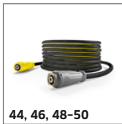
44, 46, 48-50