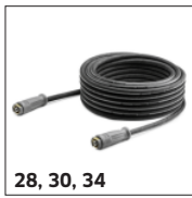
28, 30, 34