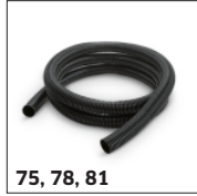
75, 78, 81