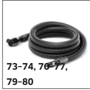
73-74, 76-77, 79-80