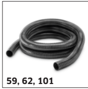
59, 62, 101